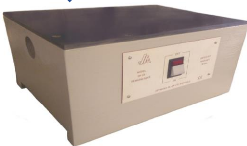
Plateau de démagnétisation pour chanfreins, tôles, petites pièces