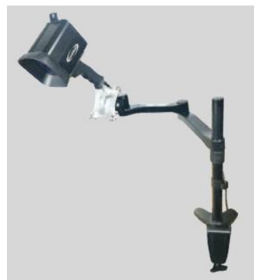
Monté sur bras