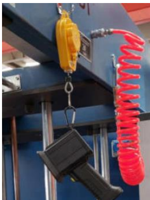
Suspendu sur support