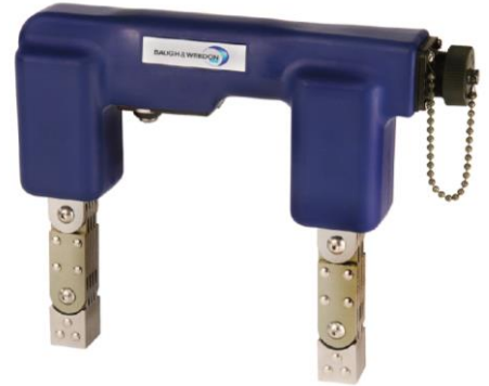
Version câble alimentation débrochable