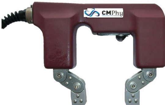
Version câble alimentation intégrée