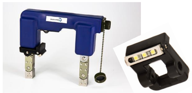
Version avec Eclairages à LEDs inductifs Existe en modèle LEDs UV ou Lumière blanche > 2000 \mu\text{W}/\text{cm}^2 / > 1000 Lux