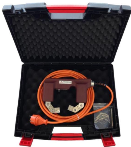
Vendu sous forme de Kit valisette