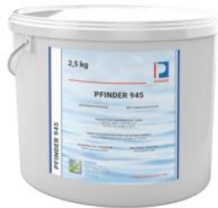
Seau de 2,5 kg

Faible odeur / Faible en sulfure et halogène