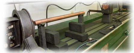
Vérification banc magnétoscopie, Ressuage